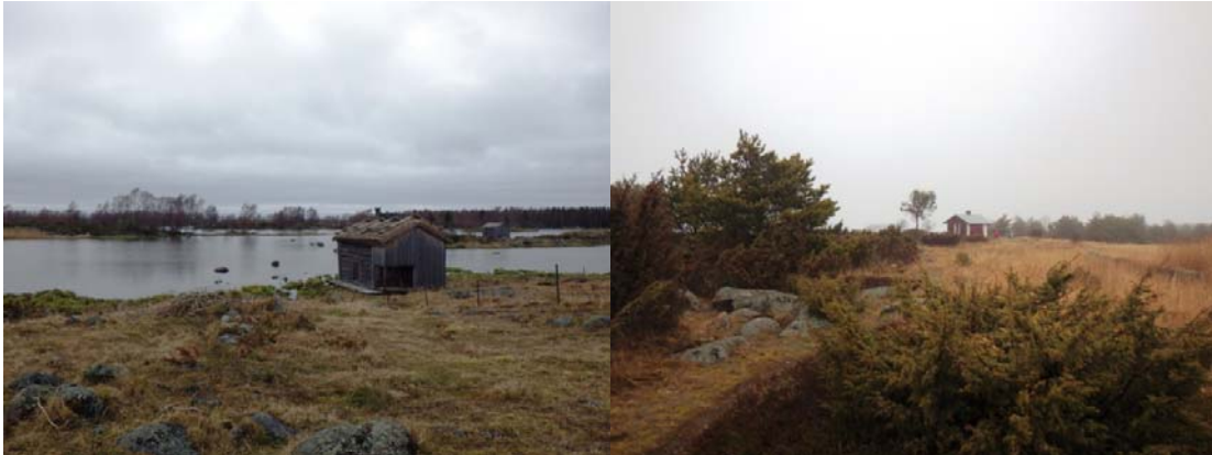
Ruoko- ja kalamajoja. Vasemmalla Svedjehamnin luontopolun varren ruoko- ja kalamaja, jossa ruokokatto. Oikealla Trutklobbarna saaren kalamaja katajaisella nummella.