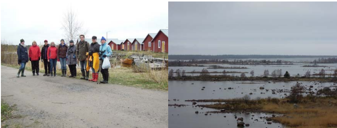
Retkeläiset maankohoamisrannikon maisemissa Svedjehamnissa.

Länsirannikon ympäristöyksikkö on kokenut 2009 perustetussa seudullisessa yksikössä positiiviseksi mahdollisuuden erikoistua ja lisätä tiedonvaihtoa muiden alan asiantuntijoiden kanssa. Paikallistuntemus on säilytetty paikallisten toimipisteiden kautta. Ympäristöyksikkö järjestää kerran kuukaudessa yksikkökokouksen, minkä lisäksi samojen aihepiirien kanssa työskentelevien henkilöiden kesken järjestetään erillisiä palaverieja. Hankaluuksia aiheuttavat eri kunnissa käytössä olleet tietojärjestelmät ja niiden yhteen sovittaminen.