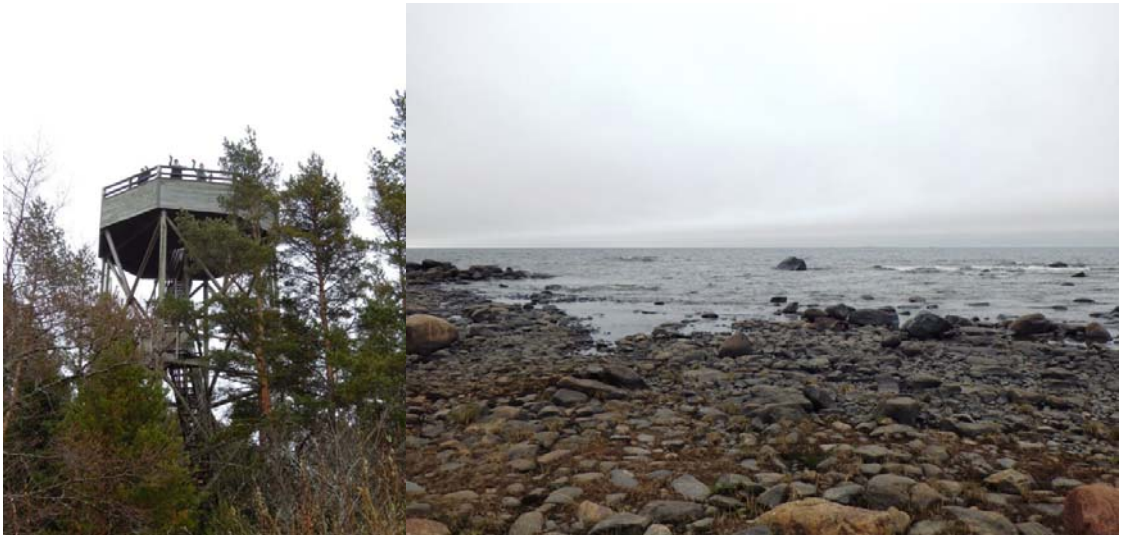
Siipyyn lintutorni ja ulappaa Siipyyn edustalla. Vasen kuva SPS ja oikea HJ.

Epävakaisista säistä huolimatta Ympäristösuojeluviranhaltijoiden hallituksen kevätretki oli ollut mitä onnistunein.